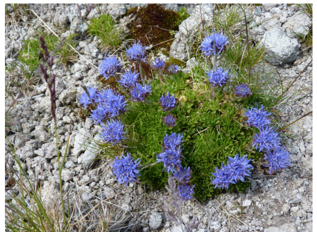
La Jasione crépue d'Auvergne

Une valeur géologique et paysagère du site de par la grande variété des édifices volcaniques. Son relief a été remodelé par le lent mouvement des glaciers lors