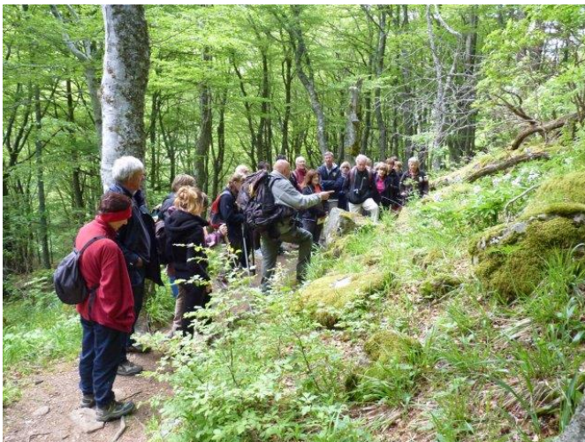
Faire partager les connaissances de la Réserve

La gestion de la fréquentation du site est une des composantes principales du plan de gestion : réfection ou suppression de sentiers, création de nouveaux plus adaptés aux pentes