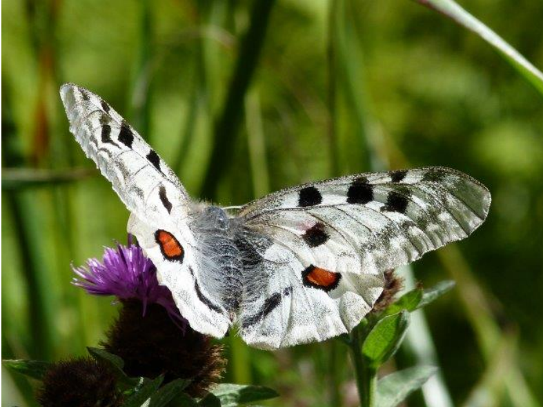
Le papillon Apollon