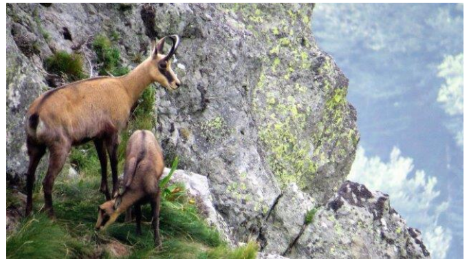
Chamois dans la Réserve

Cette protection a permis de faire de ce site glaciaire né il y a 600 000 ans, l'un des cœurs de nature à l'échelle du Parc et du massif du Sancy. La réserve naturelle offre en effet une flore et une faune protégées typiques des Alpes et des paysages à couper le souffle, qui font la fierté des habitants du massif.