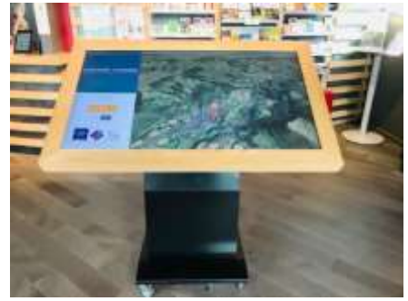
Exemple de table numérique OT Carladès / 46 pouces

Au-delà de l'adéquation de cet outil avec la nouvelle stratégie du Syndicat mixte du Parc, cette évolution dans l'animation de l'accueil touristique au siège du Parc se justifierait au regard de plusieurs éléments de contexte :