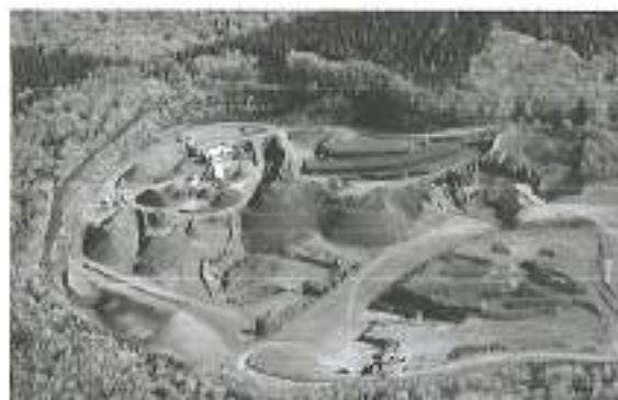
Vue aérienne du site en 2017