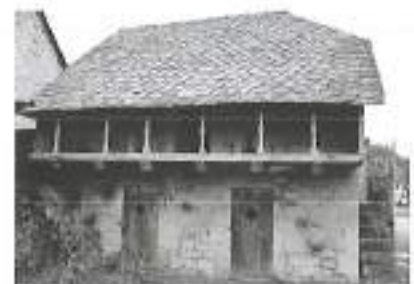
Poulailler de luxe en pierres volcaniques à Menet.

L'Association des Pierres de Menet, créée en 1986, a pour rôle de promouvoir la diversité des pierres de la commune et de mettre en valeur son patrimoine bâti. L'Association entretient également une passion pour la sculpture et organise depuis 1992 le Symposium de Menet dont le but est faire redécouvrir le patrimoine de la région du Cantal en présentant les perspectives contemporaines de l'utilisation des pierres de Menet. Les pierres utilisées par les sculpteurs pendant le Symposium sont issues de roches volcaniques qui ont toutes été utilisées en taille depuis des millénaires à Menet : on trouve le trachyte, le tuf et la phonolyte.