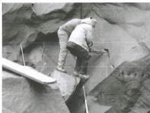
Dans les carrières, l'extraction est faite manuellement : les ouvriers travaillent le long des failles naturelles.