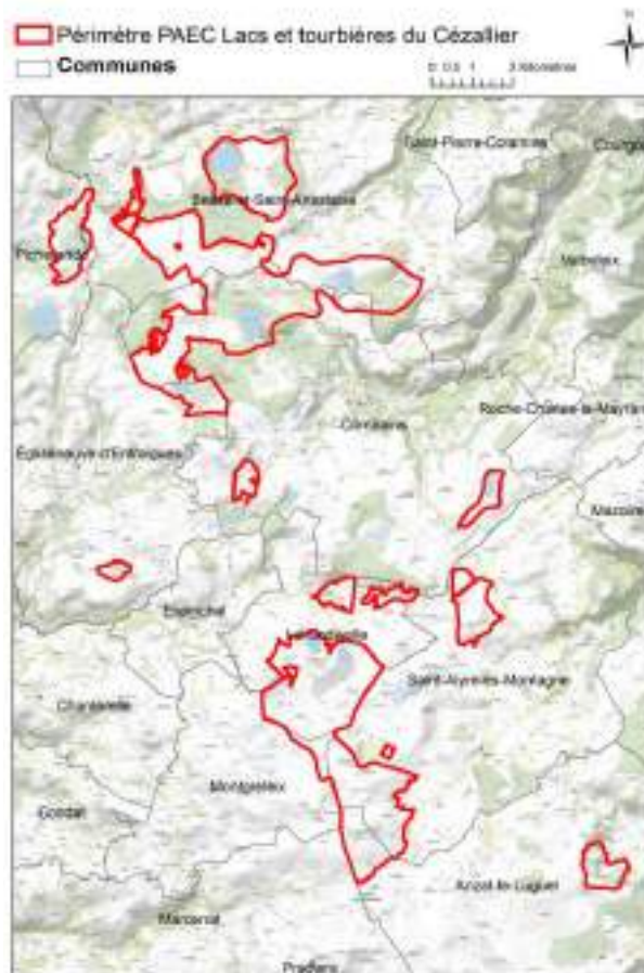
Carte 1 : Le territoire agro-environnemental

En résumé, ce territoire est identifié comme une zone d'action prioritaire à enjeu de biodiversité et eau. L'objectif est de préserver la qualité de l'eau, un bon état de conservation des pelouses, des prairies et des milieux humides.