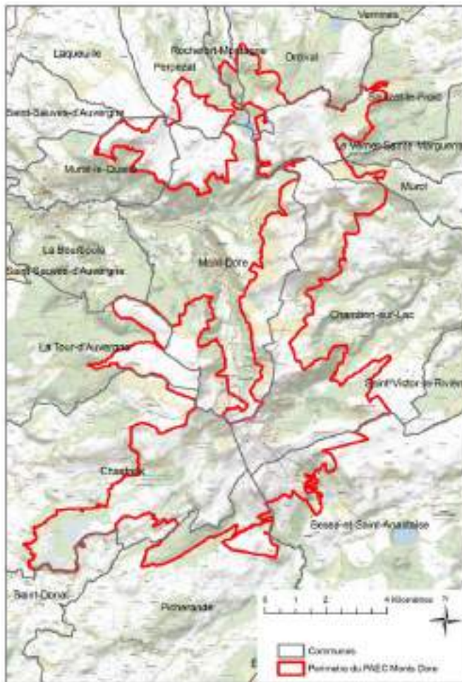
Carte 1 : Le territoire agro-environnemental

En résumé, ce territoire est identifié comme une zone d'action prioritaire à enjeu de biodiversité. L'objectif est de préserver la richesse des milieux naturels (pelouses, prairies, milieux humides) et la qualité de l'eau.