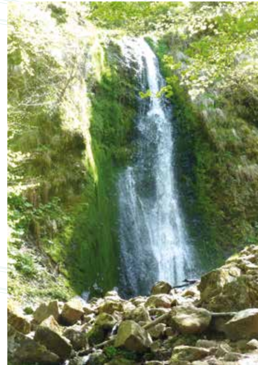
↑ Cascade de Pérouse

> carte des randonnées à télécharger www.parcdesvolcans.fr/chaudefour-randos