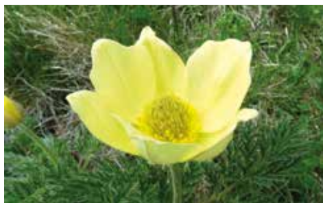
←← Anémone soufrée