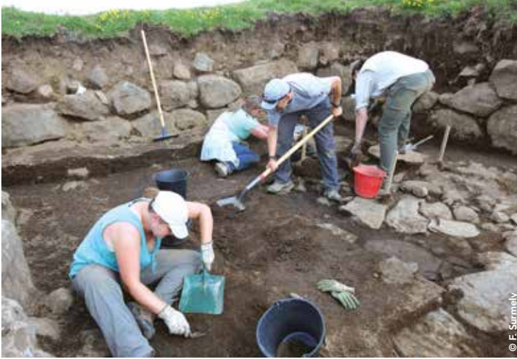
←←← Chantier de fouilles à Compains (Cézallier)