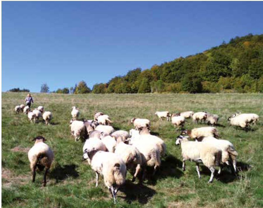
Le troupeau ovin mobile ouvre la voie...