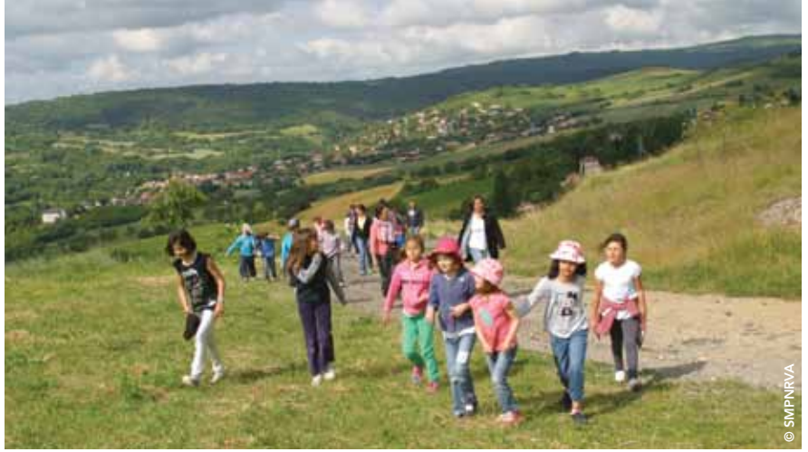
En 2014, les échanges « Ville-campagne » ont concerné seize classes. ➤➤➤