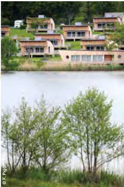
←← Le village vacances de Menet a fait peau neuve.